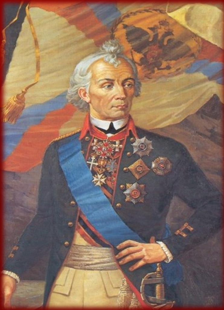
Суворов А.В. Генералиссимус российских сухопутных и морских сил

Орден четвертой, высшей степени носили на ленте через плечо, звезда – на левой стороне груди.