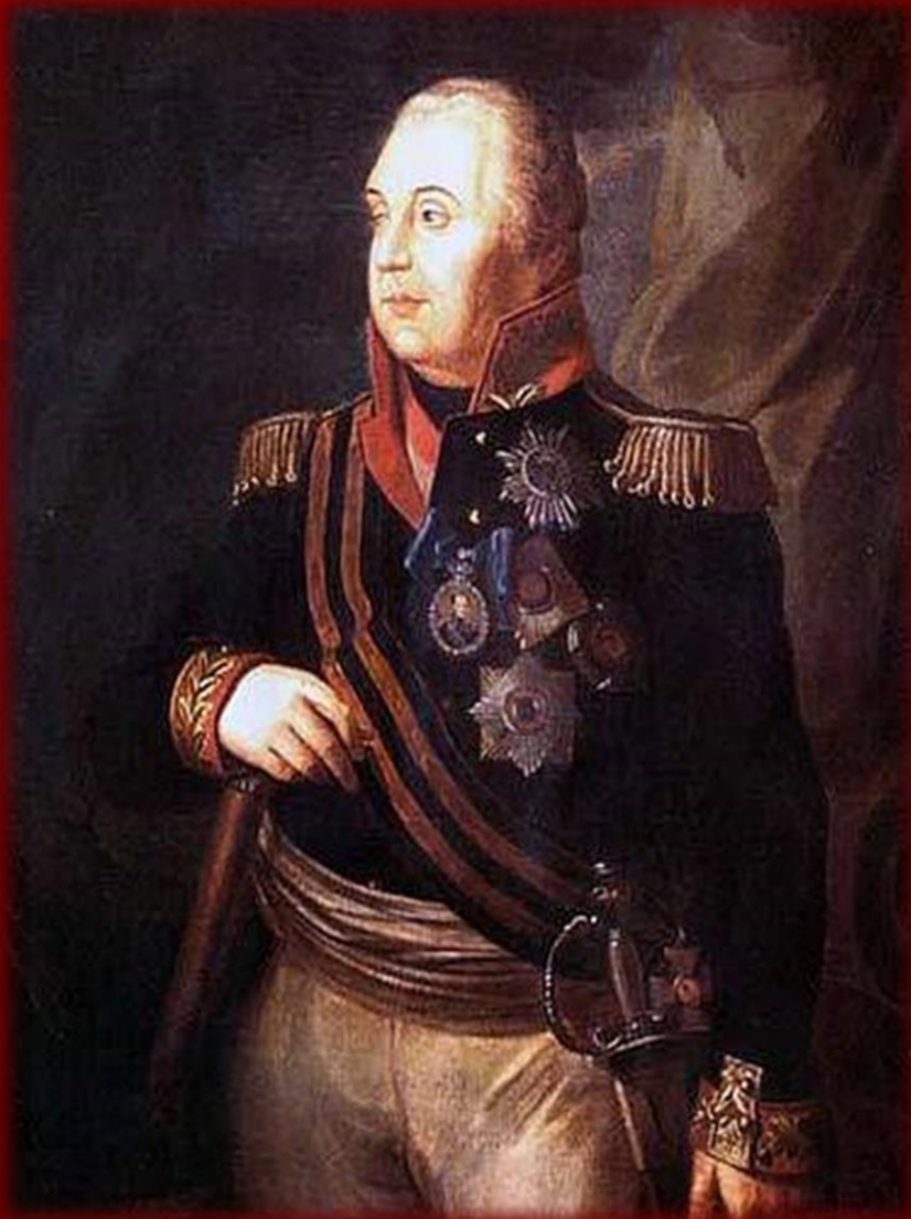
Кутузов М.И., полный кавалер ордена Св. Георгия.

Георгий третьей степени – большой крест на шейной ленте и звезда на груди.