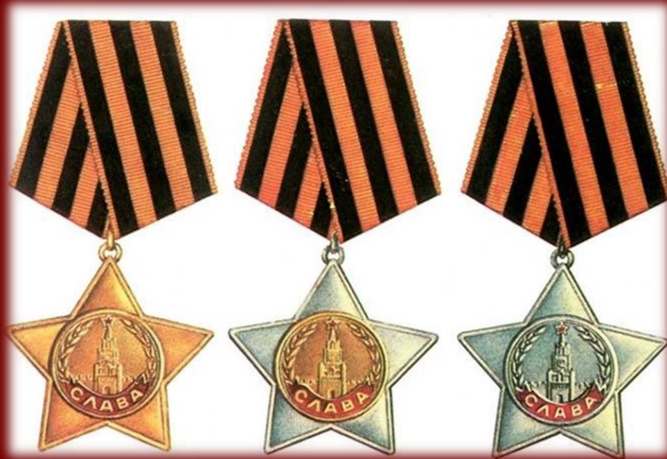
Орден Славы 1,2 и 3 степени.

В годы Великой отечественной войны вспомнились имена лучших русских полководцев и их победы, одержанные в безнадежных, казалось бы ситуациях: Дмитрий Донской и Куликовская битва, Александр Невский и Ледовое побоище, Суворов и взятие Измаила и многое другое. Вспомнили и о Георгиевских крестах, самую боевую, самую героическую русскую награду. Именно Орден Святого Георгия стал прообразом ордена Славы.