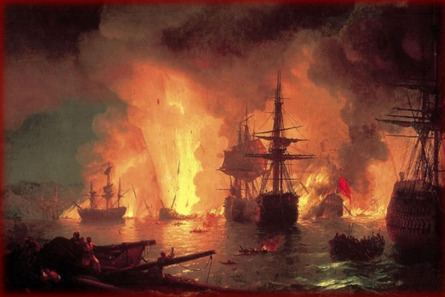
И.К. Айвазовский Чесменский бой

Примером подвига, за который можно было получить Св. Георгия, может служить подвиг Дмитрия Сергеевича Ильина. Произошло это в русско-турецкую войну, в 1770 г. После сражения с русской эскадрой турецкие корабли зашли в Чесменскую бухту, вход в которую защищали береговые батареи, и были там блокированы.