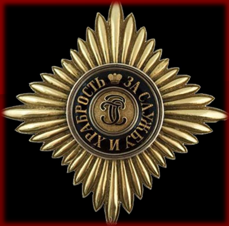
Золотая звезда к ордену Св. Георгия I степени

К ордену 1 и 2 степеней прилагалась так же золотая звезда, на которой вокруг вензеля с буквами СГ располагается девиз «За службу и храбрость». На ленте чередовались черные и желто-оранжевые полосы. Эта лента всем хорошо знакома, называется она георгиевская лента. Уже несколько лет существует в нашей стране обычай - в День Победы волонтеры раздают ленты на параде Победы. Это и есть георгиевская лента - одна из составляющих ордена Святого Георгия.