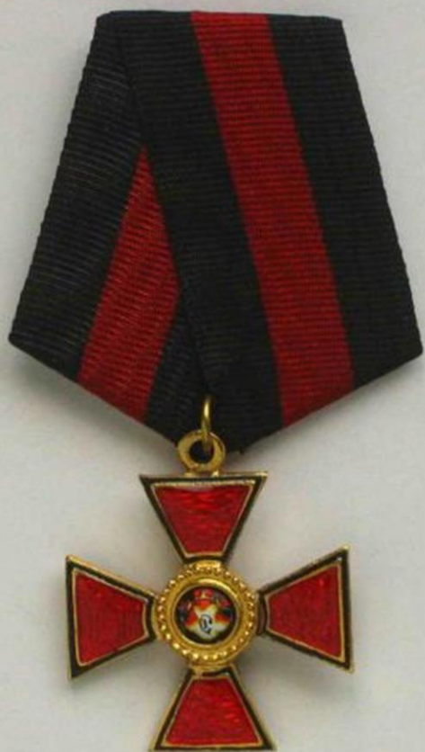
Орден Святого равноапостального Князя Владимира

Орден Святого равноапостольского князя Владимира вручался за выслугу лет. На разных степенях этого ордена были надпись «35 лет», «25 лет», «18 компаний», «25 компаний». Безусловно, 35 лет государственной службы или 25 военных компаний – немалые заслуги. Но статусом ордена не оговаривалось, какого качества должна быть служба, какой вклад служивший сделал в ходе тех или иных баталий, какое воинское умение или личную доблесть проявил. Им награждались как военные, так и гражданские служащие. Военные – за компании, чиновники – за выслугу лет.