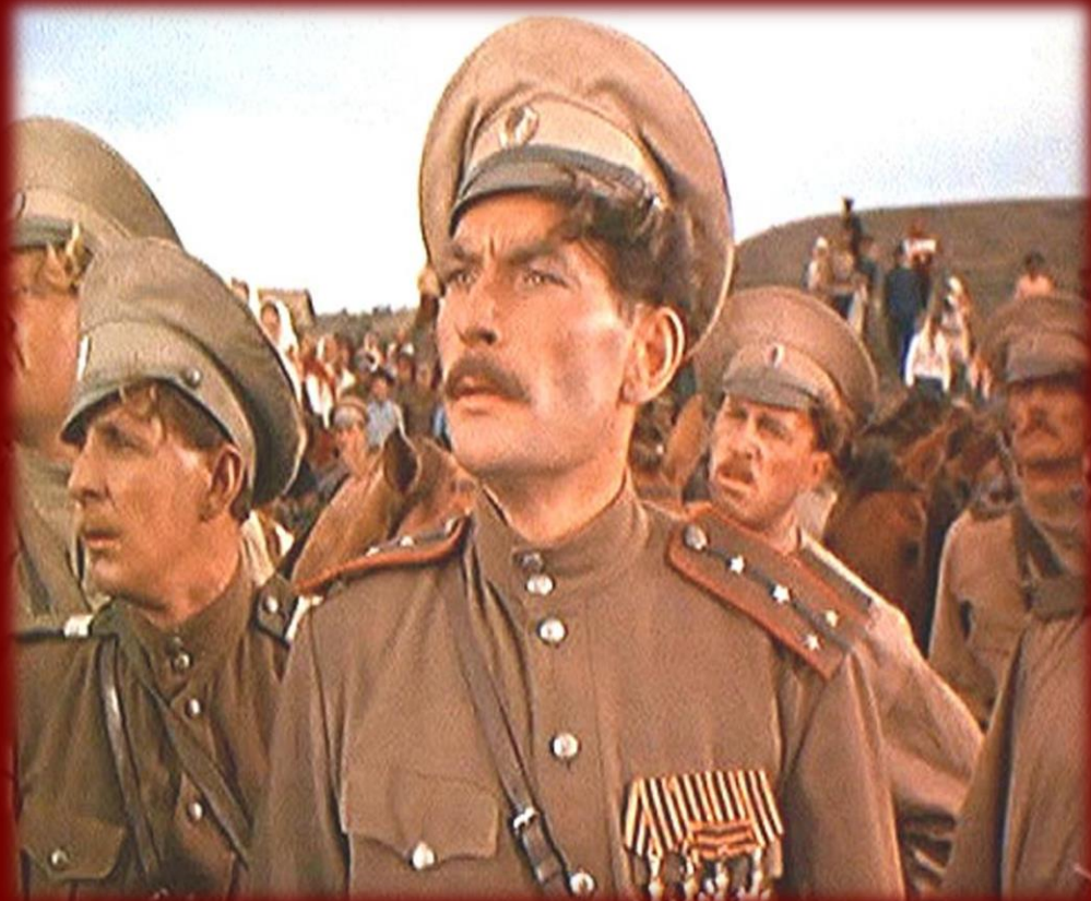
кадр из фильма «Тихий Дон»

Согласно сюжету романа, по которому был снят фильм «Тихий Дон», главный герой Григорий был призван в армию в 1913г. Участвовал в Первой мировой войне, в частности в Брусиловском прорыве. Награжден 4 Георгиевскими крестами.